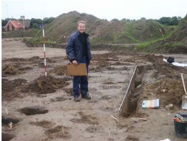
Figur 2: Efter muldafrømningen fremstår de forhistoriske anlæg som mørke aftegninger i den lysere undergrund.