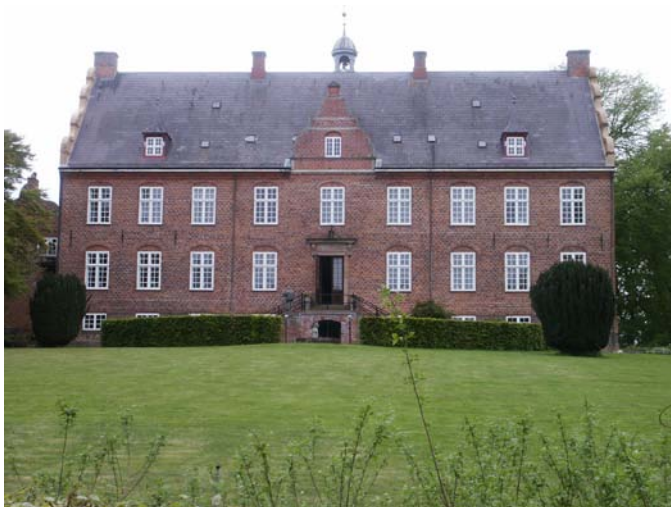
Hovedbygningen på Sanderumgård fra haven